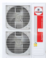
Model : CCS-32ME36, 48, 60