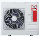
Model : CCS-32ME30