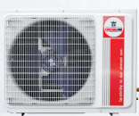
Model : CCS-32ME25